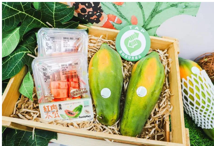
↑ 嘉義優鮮木瓜水果盒，在全家上市

嘉義縣政府輔導的水上鄉果樹產銷班第 13 班的智慧生產木瓜首次進入全家便利商店，與福和生鮮農產股份有限公司攜手合作，共同推出免削皮盒裝鮮切木瓜水果盒，將為期一個月，讓消費者在秋意濃的 11 月以輕鬆便利的方式，享受到來自嘉義優先的秋季金賞木瓜好滋味。