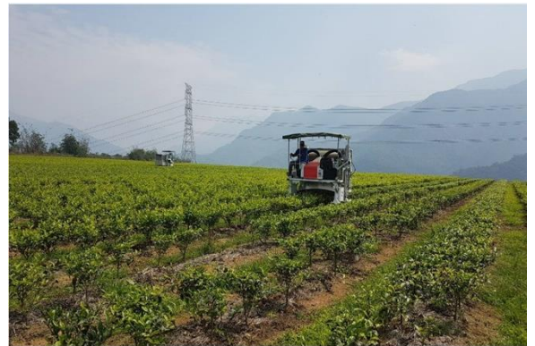
↑ 乘坐式採茶機運作情形

從田間生產、採收到製茶廠等方面進行智慧化管理技術的開發。改進了植茶機預投苗機構，以提高投苗效率、減輕作業負擔，並增加茶樹的存活率。同時，引入了茶園病蟲害辨識與雙向溝通系統，使植保專家能夠快速收到信息，進行即時診斷並提供防治藥劑建議，降低