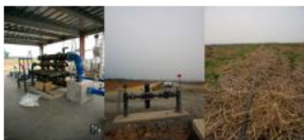
茶園自動滴灌系統

以物聯網回傳中控室電腦介面，依據土壤溫濕度、導電度、空氣溫濕度及降雨量等氣象因子，導入適合之灌溉量，初步建立灌溉決策系統。