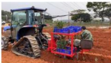
曳引機附掛式植茶機之研發

茶園更新工作需深耕、鬆土、開溝及種植，其中傳統種植作業需最多工人，且仍以人工方式種植作業。為解決種植缺工之問題，本場開發「曳引機附掛式植茶機」，比傳統人工種植效率高 5-6 倍，機械種植所需人力為人工種植之 20%，同時大幅降低種植作業負擔。