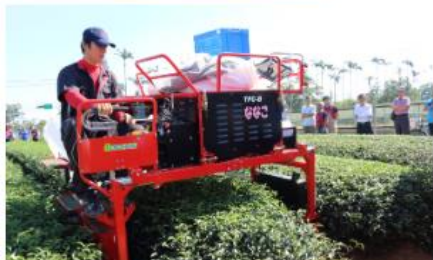
乘坐式採茶機之推廣

茶改場引進乘坐式機械採收管理來降低人力成本，提高作業效率與產量。目前臺灣茶產業逐漸往商業模式運作，但苦於人力老化與工資提高，臺灣自產的商業茶成本較高，也無法自產足夠的量供給國內飲料市場，造成進口茶的量逐年增加。但臺灣乘坐式機械的操作模式與機械化茶園建置方式還不夠成熟，需建立乘坐式機械化之示範茶園，從 107 年引進採茶機推廣至今，推廣面積已達 600 公頃，並輔導茶農建立代耕模式，逐步將平地茶園乘坐式機械化，解決缺工問題，同時降低茶葉成本並提高產量，減少臺灣對進口茶的需求量，進而復甦臺灣茶葉外銷的榮景。