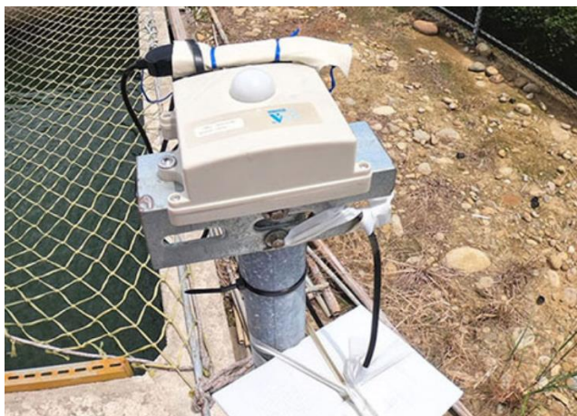
溫室外累積光度環境感測器