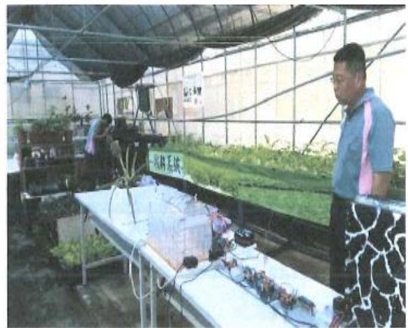
水耕自動供水,停水自動灑水自動滴灌